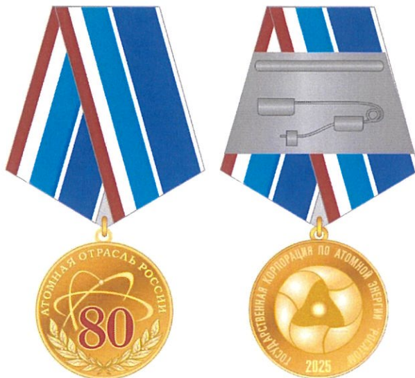
Рисунок и описание

Юбилейная медаль «80 лет атомной отрасли России» стандартной круглой формы диаметром 32 мм с выпуклым рантом по окружности.